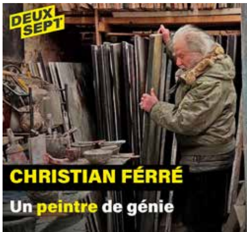
CHRISTIAN FERRÉ Un peintre de génie