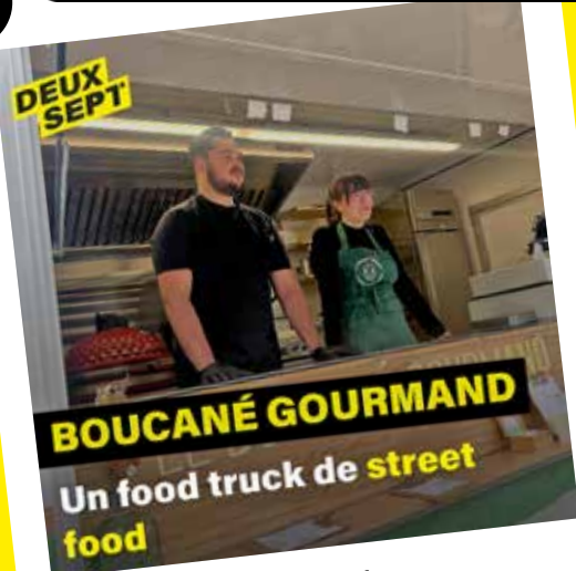
BOUCANÉ GOURMAND Un food truck de street food