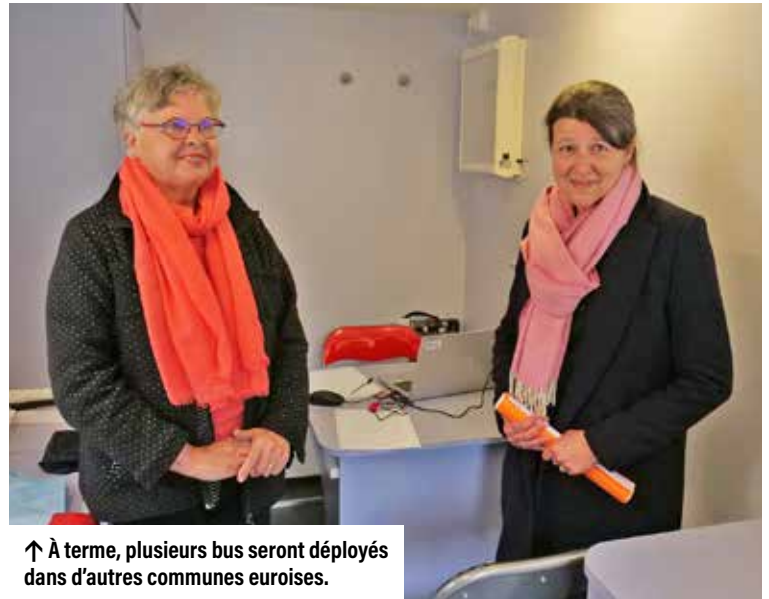
↑ À terme, plusieurs bus seront déployés dans d'autres communes euroises.

Le bus sillonnera dans un premier temps le territoire du sud de l'Eure. Trois médecins jeunes retraités ont été recrutés en tant que salariés à temps partiel par le centre de santé de la Musse à Saint-Sébastien-de-Morsent. C'est ce dernier qui gère les prises de rendez-vous avec les patients. Chaque médecin sera présent le même jour de la semaine dans la même ville afin de garder la relation patient-médecin. Ce dispositif s'adresse en priorité aux patients sans